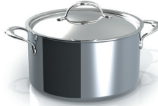
Covered Stockpot 8qt / 7.6L / 26cm