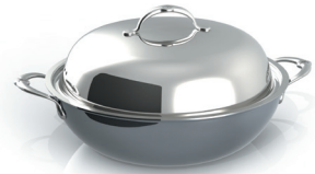
Covered Wok 14in / 36cm